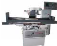
Flachsleifmaschine A 525 AMS 100 ECO