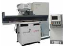
Profilschleifmaschine A 525 PNC 800

Service, Wartung, Überholung von JUNG-Schleifmaschinen